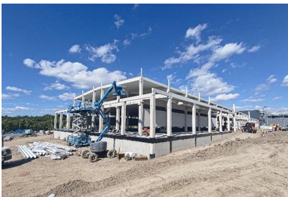
Expanze DC7 T-Mobile

V rámci aktuálního portfolia nemovitostí v uvedeném období probíhala řádná údržba a správa všech objektů. Nebyly identifikovány žádné významné vady či nedodělky. Paralelně s výše uvedenou aktivitou probíhají další jednání o nákupu vhodných nemovitostí.